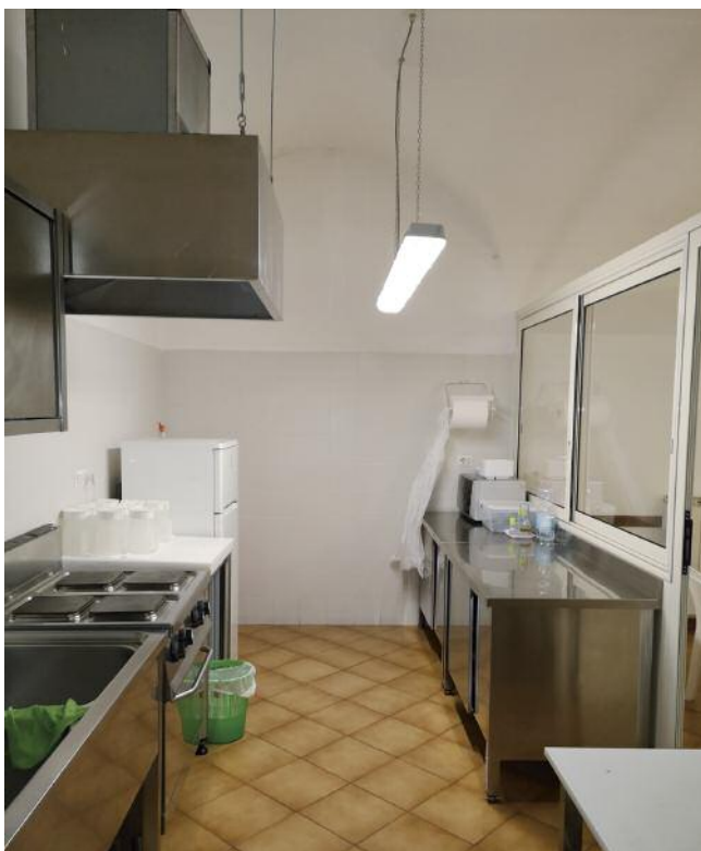
Cucina della mensa fraterna